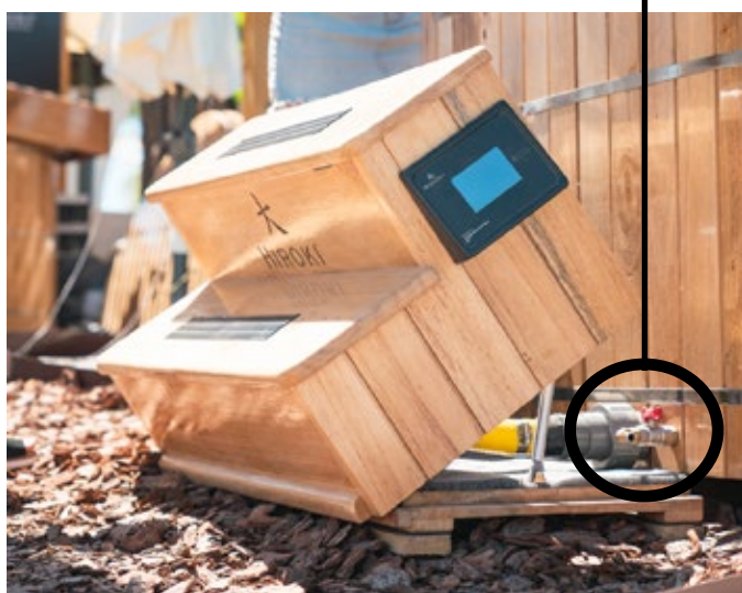
HIROKI PATAGONIA - ANDES