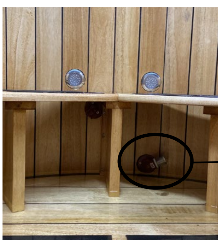
FILTRO DE SUCCIÓN

• Desenroscar y limpiar filtro de acero inoxidable